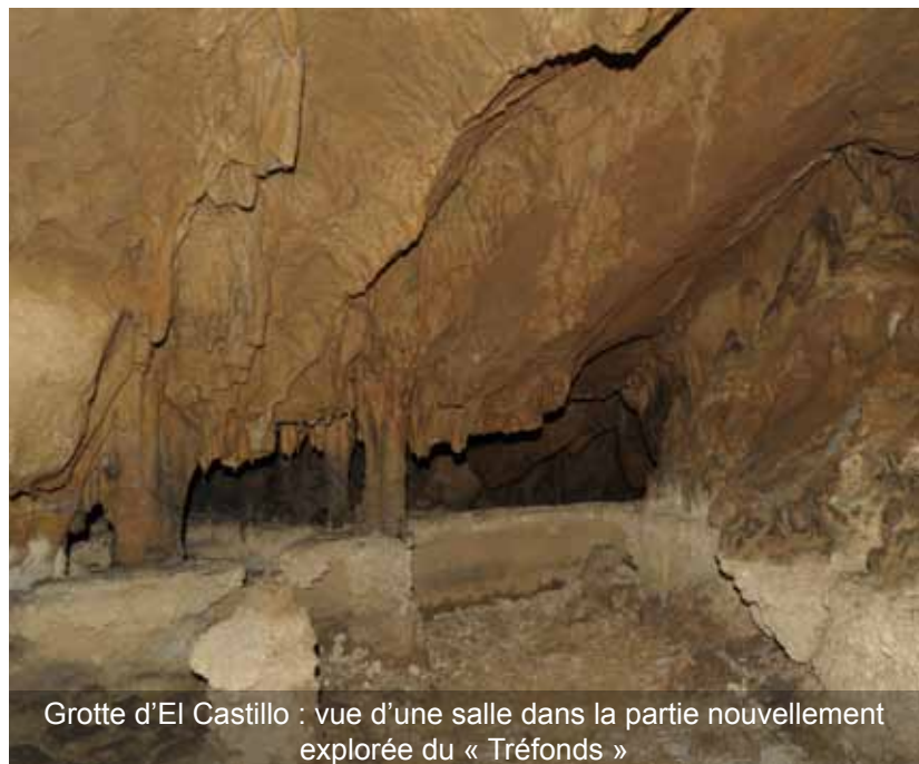
Grotte d'El Castillo : vue d'une salle dans la partie nouvellement explorée du « Tréfonds »

Grotte d'El Castillo (Puente Viesgo, Cantabrie, Espagne) . La mission d'hiver 2009-2010 de Marc Groenen à la grotte d'El Castillo, classée au Patrimoine Mondial de l'Humanité depuis juillet 2008, a été particulièrement fructueuse. Quelque 85 motifs gravés et 17 motifs peints ont été ajoutés à l'inventaire, portant à 269 le nombre total de gravures et à 1542 le nombre total de peintures et dessins. Un travail important fut l'exploration d'une nouvelle partie du réseau située dans la partie la plus profonde de la grotte (le « Tréfonds ») et la découverte de zones quasi inexplorées, qui seront topographiées lors de la mission d'été 2010. Une autre découverte importante fut celle de nouvelles empreintes de pieds d'enfant chaussés dans le « Tréfonds ». Enfin, l'existence de représentations animales sculptées sur terre a pu être mise en évidence dans la Salle A.