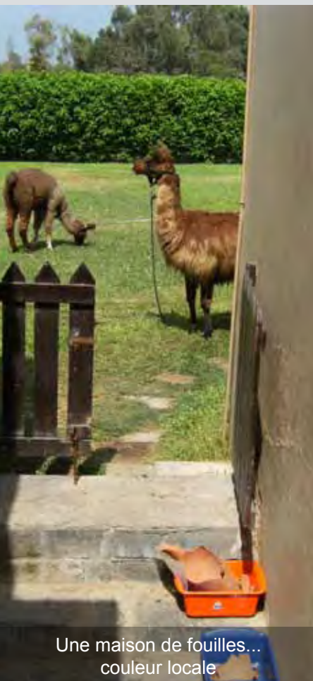
Une maison de fouilles... couleur locale

La deuxième campagne post-fouilles du Projet Ychsma sous la direction de Peter Eeckhout s'est déroulée de février à fin avril 2010 au musée de site de Pachacamac, où est entreposé le matériel archéologique récolté depuis les débuts du projet en 1999.