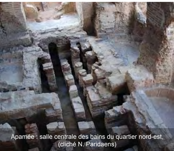
Apamée : salle centrale des bains du quartier nord-est