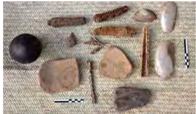
Village de Arimaladi, février 2010- Une « trousse à outil » de potière, point focal des enquêtes menées cet hiver au Niger