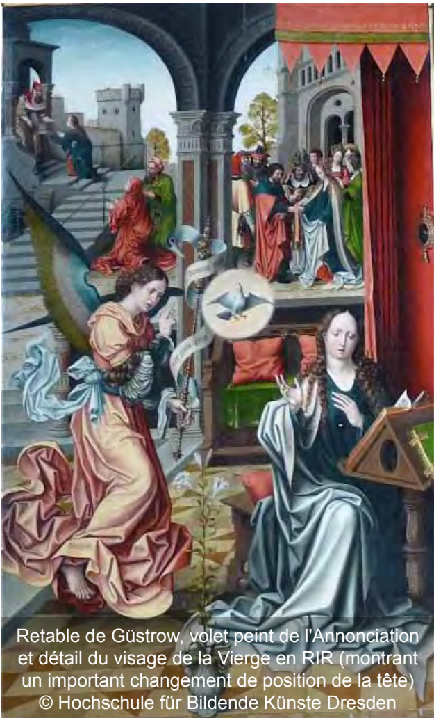
Retable de Güstrow, volet peint de l'Annonciation et détail du visage de la Vierge en RIR (montrant un important changement de position de la tête)

Retable de la Passion de Güstrow : Une nouvelle mission concernant la restauration et l'étude technologique du Retable de la Passion de Güstrow a eu lieu les 14 et 15 juin 2010. L'objectif était de discuter des résultats des examens scientifiques des œuvres devant les volets du retable déposés. L'investigation scientifique des panneaux a été exécutée en collaboration internationale avec la Hochschule für Bildende Künste de Dresde (Prof. Dipl. Rest. Ivo Mohrmann, Studiengang Kunsttechnologie, Konservierung