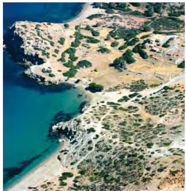
Vue aérienne du site d'Itanos, Crète

Didier Viviers a présenté un séminaire intitulé Facing the Sea : Cretan Identity in a Harbour-City Context , le 31 mai 2010 à l'Université d' Oxford (Ioannou Center for Classical and Byzantine Studies).