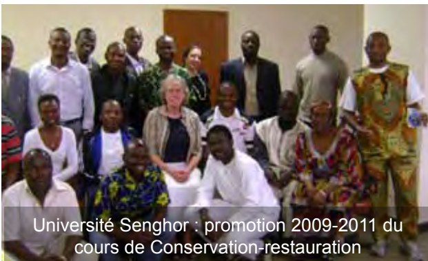
Université Senghor : promotion 2009-2011 du cours de Conservation-restauration