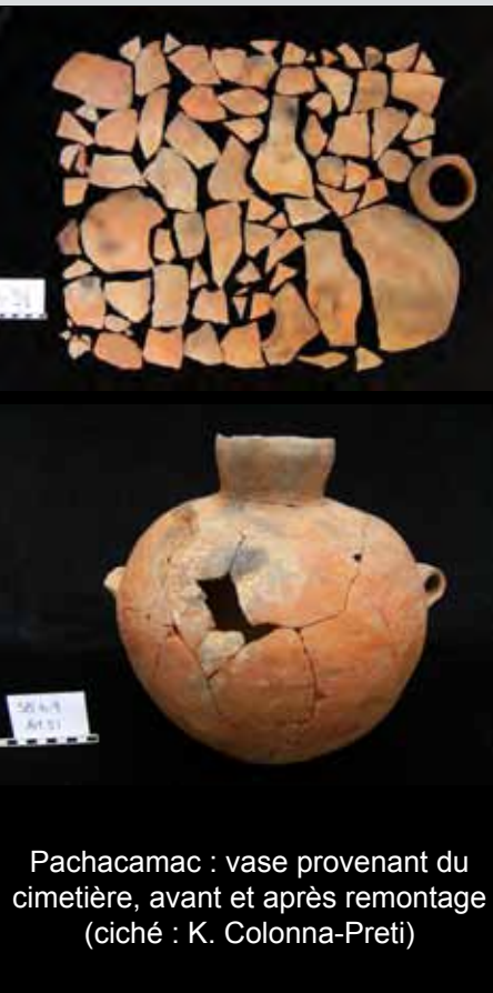
Pachacamac : vase provenant du cimetière, avant et après remontage