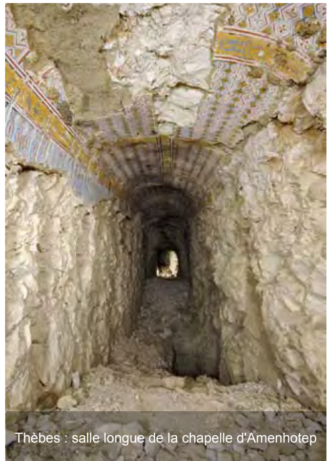
Thèbes : salle longue de la chapelle d'Amenhotep

Thèbes (Égypte). La 12 e campagne de la Mission archéologique dans la Nécropole thébaine s'est déroulée en janvier 2010 sous la direction de Laurent Bavay . Le dégagement de la tombe C.3 d'Amenhotep, découverte en 2009 (voir Lettre d'information n° 2), s'est poursuivi et a permis d'accéder à la deuxième salle de la chapelle funéraire. Cette chambre longue et étroite a conservé un plafond voûté peint de motifs géométriques et de bandes de textes hiéroglyphiques ; comme c'était déjà le cas dans la première salle, les peintures qui décoraient les parois ont été découpées, sans doute durant la première moitié du XIX e siècle ; un beau panneau montrant le défunt offrant au dieu Anubis couché sur un naos a toutefois été préservé sur le mur est, au-dessus du passage (voir p. 15). Dans ce couloir s'ouvre un puits funéraire, en partie vidé anciennement. Le fond de la salle, ouvrant sur une chambre à piliers inachevée, est encombré par les vestiges de l'activité des pilleurs de momies. Dans la cour à l'extérieur de la chapelle, la fouille a révélé une structure quadrangulaire massive en briques crues. Cette construction correspond probablement à une petite pyramide similaire à celles qui surmontent les tombes d'époque ramesside dans la nécropole thébaine.