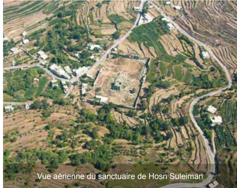
Vue aérienne du sanctuaire de Hosn Suleiman