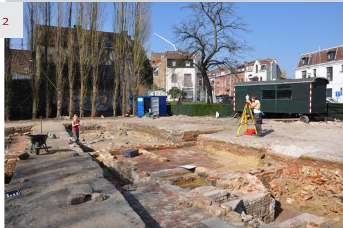
1. Vue générale des structures les plus anciennes repérées sur le site.