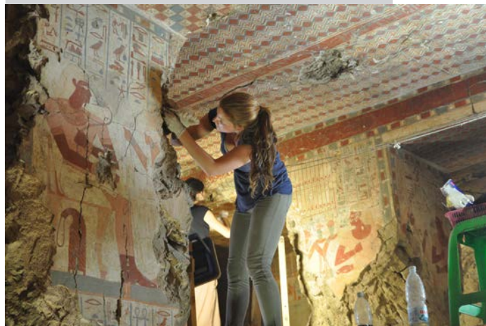
Thèbes, conservation-restauration des peintures murales dans la chapelle de Sennefer.