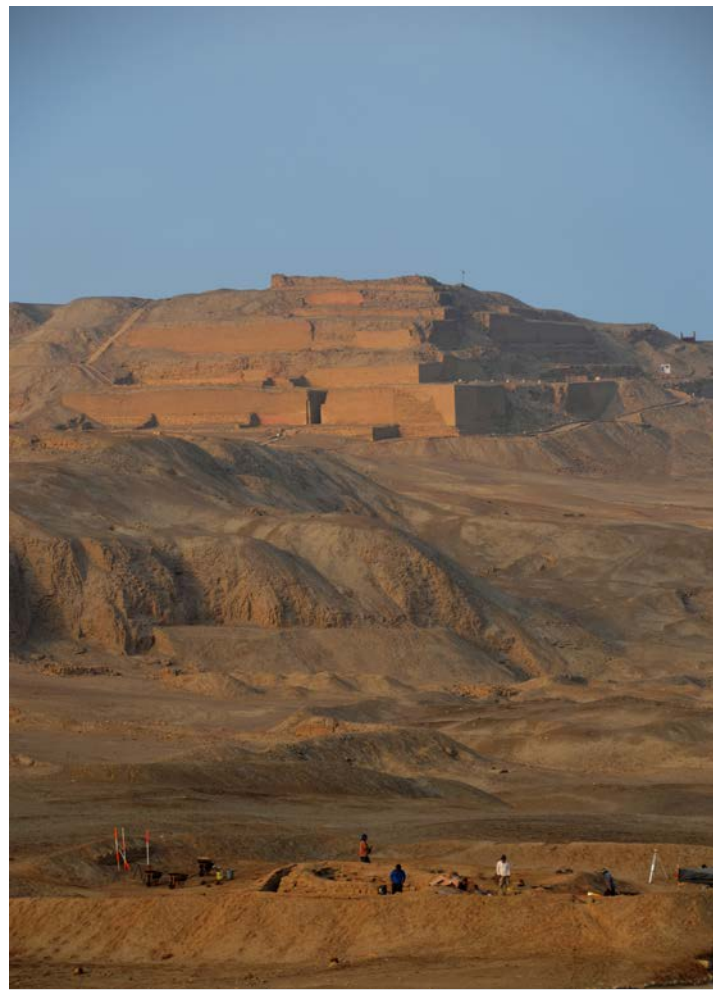
Pachacamac, fouilles en cours mars-avril 2014.