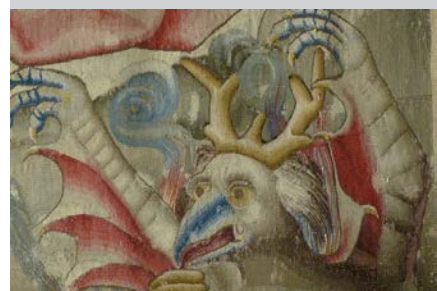
Tapisserie du Jugement Dernier (détail).