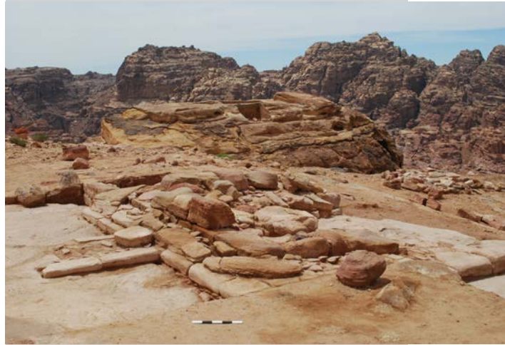
Pétra, Jabal Khubthah. L'autel monumental nabatéo-romain, vers le nord-ouest. Mai 2014.