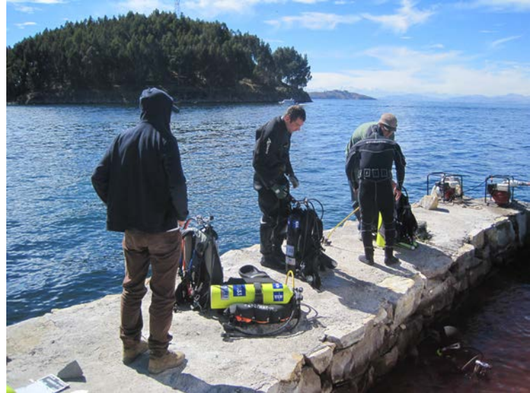
Titicaca « Puncu », préparation d'une plongée sur le site du port précolombien

Les opérations se sont également concentrées sur le traitement des données de 2013 (archéométrie des métaux, analyses des carottes sédimentaires, etc.) et sur l'aménagement d'un espace de travail et d'un dépôt de fouilles. Un nouveau programme de trois ans est en cours de finalisation en partenariat avec le gouvernement bolivien pour les trois prochaines années.