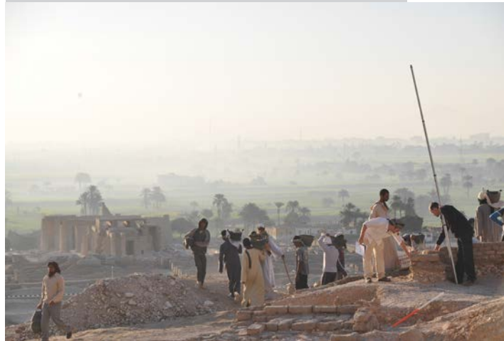
Thèbes, le chantier au petit matin de février, le Ramesseum et la vallée du Nil en arrière-plan.