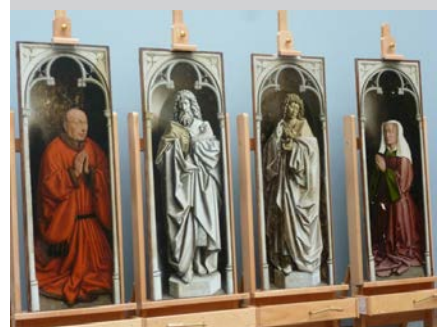
Hubert et Jan van Eyck, Retable de l'Agneau Mystique, 1432, revers.