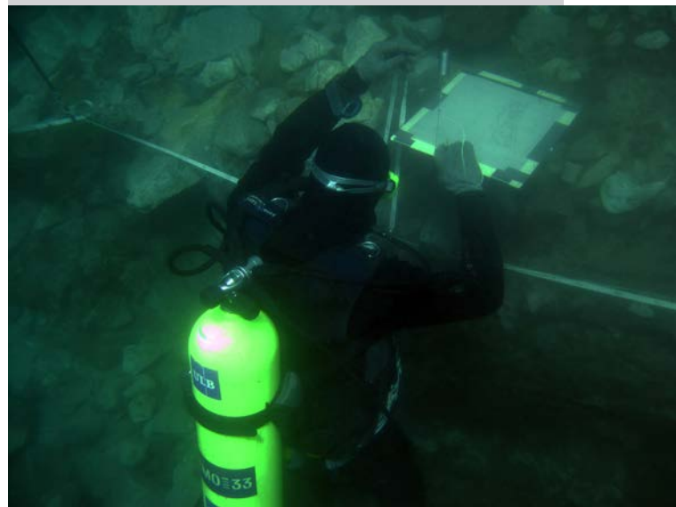
Titicaca « Puncu », relevé d'une stratigraphie à 4 m de profondeur